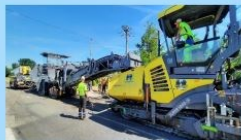
Retraitement des matériaux de chaussée à 100 %

Voies douces enrobés drainants - Lutte contre les îlots de chaleur